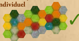
Plateau de jeu individuel